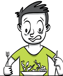
מכת ה"צריך לגמור"

דרג את הקושי מהקל אל הכבד: תינוקות שניזונים מדייסות דגנים, מתבגרים שמחסלים 4 פיתות וחצי כיכר לחם ביום ושונאים מצה, המתבגרים הנ"ל שהם גם צמחונים אוכלי שניצל טבעול (לרוב תירס או תרד בלבד), המתבגרים הנ"ל שהם גם אשכנזים מאותגרי קטניות בפסה.