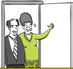
מכת ה"היינו בסביבה אז קפצנו, איזה כיף לראות אותך אחרי כל השנים, את נראית נהדר!"

עם כל הכבוד לדצ"ך עד"ש באח"ב ולשיר האלמותי "אלו אלו עשר המכות... ויהי ה-ה-ה דם דם דם, הצפרדע והכנים-נמ-נמ", אני הייתי מוצאת מכות אחרות להג, שלמרות השנה המעוברת, מתעקש להתקרב. ויש הרבה יותר מעשר מכות. למנות לכם? לתת בהן סימנים?