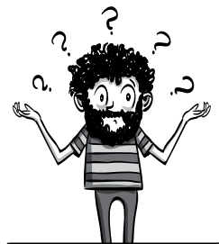
מכת ה"מה כבר יש לנוקו?"

בשבוע לפני פסח התפריט שלנו מורכב משילובים אותנטיים: סנדביץ' עם דגני בוקר בתוספת אפונה ונקניקיות סויה, פסטה שדבוקה לבורקס מרוח בחמאת בוטנים, פירורי אוזני המן עם כוסמת, פתייתים, רבע פיצה נוקשה וריבה.