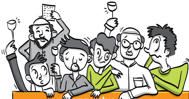
מכת כולנו מסובין

כשהאף שלך קבור עמוק בתוך הקרוסלה של הסירים, המגירות מונחות על הרצפה ותכולתן פרושה בתפזורת לידן, החלקים של הכיריים בהשרייה בחומר חריף - הוא מחליט לצטט את הרב שאמר שאפשר לגמור את הניקיון לפסח בחצי יום.