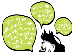
מכת הרי זה משובח