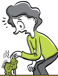
מכת הממצא המתור

לא ראית אותם לפחות 40 שנה. בעצם, את בכלל לא בטוחה שאת מכירה אותם. הם עומדים בדלת עם חיוכים של פגישת מחזור מיוחלת, ואת נושפת זיעה מהולה באקונומיקה בניחוח אורנים. את מנסה לנגב את הידיים, לשמוט את הסמרטוט,