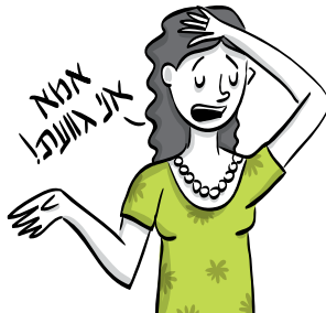
מכת ה"אין מה לאכול!"

כל שנה את נשבעת שלא תקני יותר את העוגיות המתוקות להחריד, ובמיוחד כשכולם שונאים קוקוס. אבל האורחים שמגיעים לא אוכלים קטניות ולא מצה שרויה ואלרגיים לכל מה שזז, אז את מתפשרת וקונה ונתקעת עם זה עד לפסח הבא.